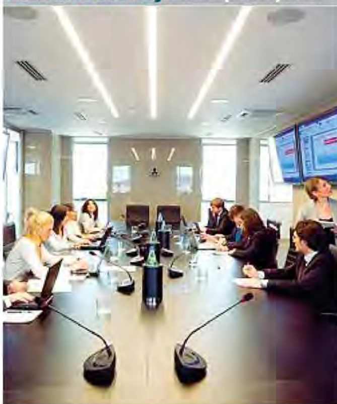
Riunione in un ufficio del gruppo Accenture