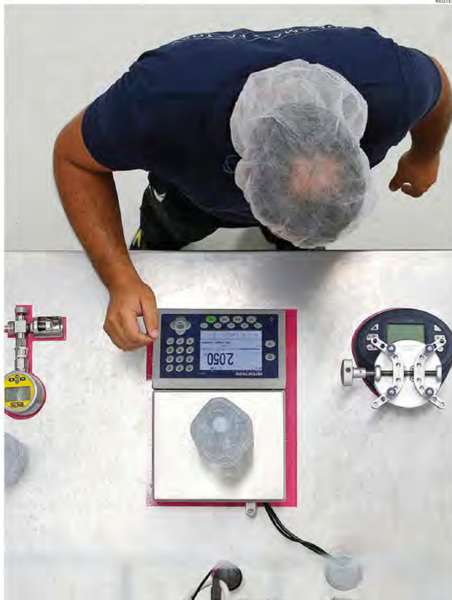
All'avanguardia. Un lavoratore della smart factory di Castrocielo (Fr) dove s'imbottiglia l'acqua Vera