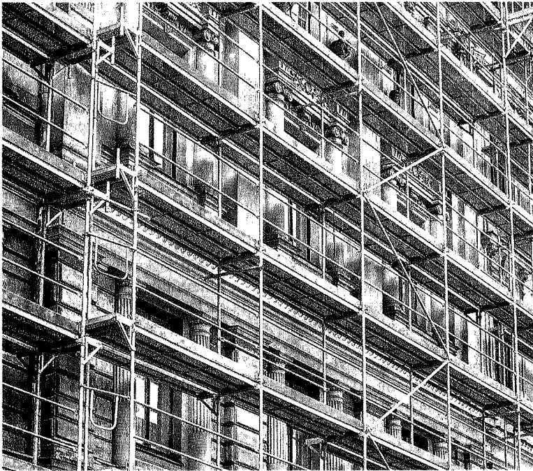
Superbonus. La disponibilità del Mef ad accogliere alcuni emendamenti ordinamentali di semplificazione ulteriore si è scontrata con altre opposizioni dentro il governo

le forze politiche punta a rafforzare il ruolo della Capitale nell'attuazione del Pnrr e in vista degli altri appuntamenti di rilancio della città, a partire dal Giubileo.