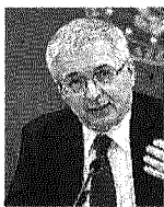
Il ministro dell'Economia e delle Finanze, Daniele Franco. La riforma della concorrenza è stata ieri al centro della cabina di regia