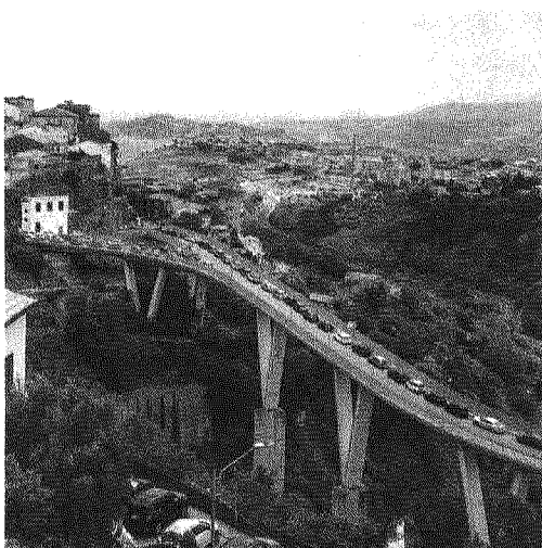
Viadotto Il «Bisantis» costruito da Riccardo Morandi

● Quattro gli arresti: un maresciallo, i due titolari dell'azienda Tank e la dipendente di un'altra ditta